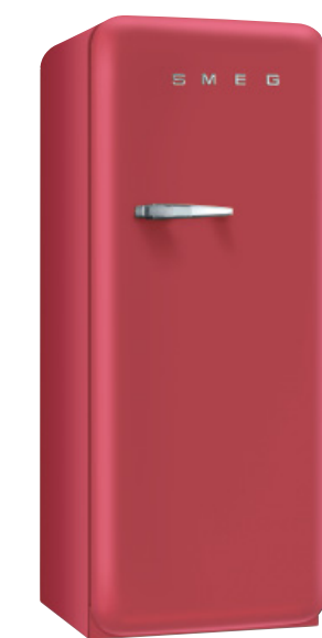
FAB28RRV1 CZERWONY AKSAMIT Uchwyt i logo w kolorze srebrnym