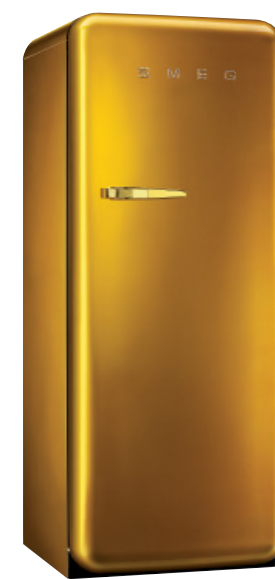
FAB28RDG ZŁOTY Uchwyt w kolorze złotym, Logo Smeg MADE WITH SWAROVSKI ELEMENTS