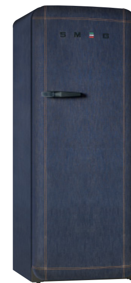
FAB28RDB JEANS Czarny uchwyt Soft Touch