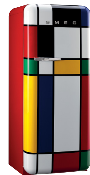
FAB28RDMC MULTIKOLOR Uchwyt i logo w kolorze srebrnym